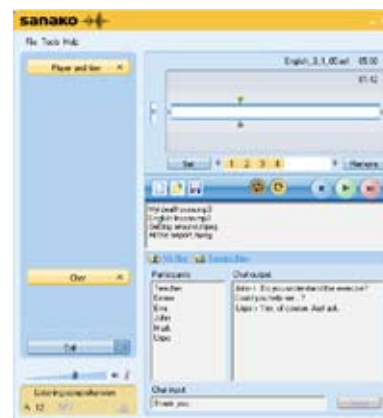
Központi tanulói panel

A SANAKO Study 1200 szoftver moduláris szerkezete